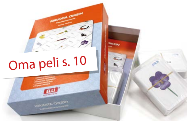
Oma peli s. 10