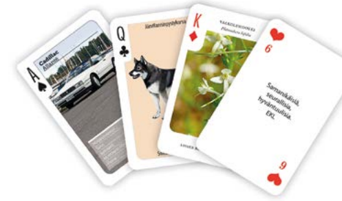
Special - oma design