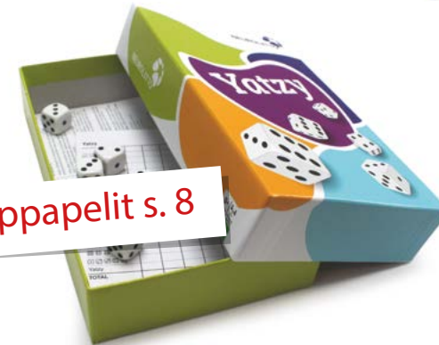
Noppapelit s. 8