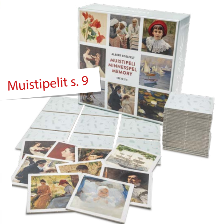
Muistipelit s. 9