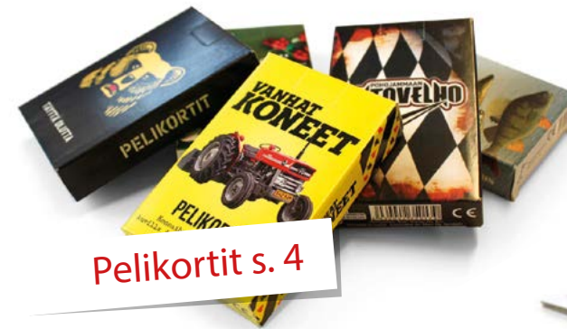
Pelikortit s. 4